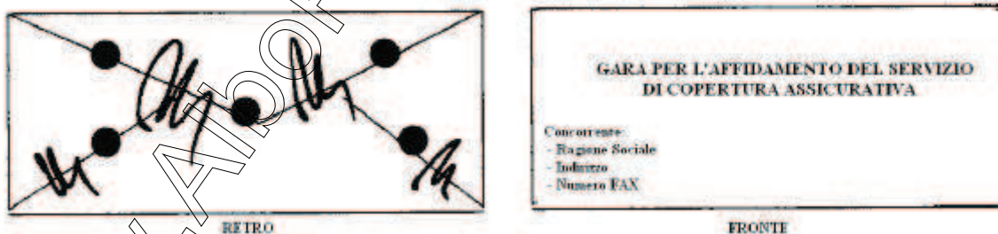
Esempio Plico Principale

e devono risultare chiaramente leggibili gli elementi identificativi del concorrente quali Ragione Sociale indirizzo e numero FAX ( a titolo puramente esemplificativo vedere figura sottostante).