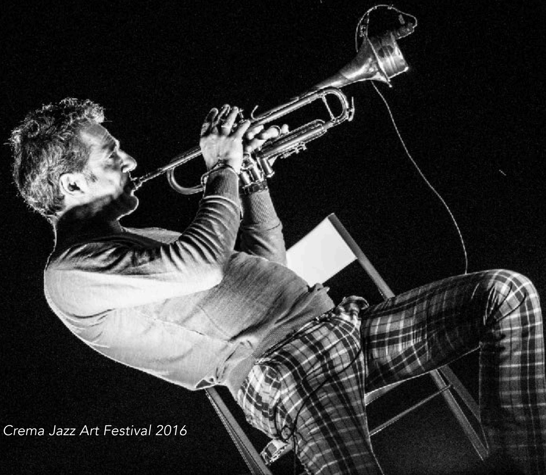
Paolo Fresu, grande protagonista a Crema Jazz Art Festival 2016