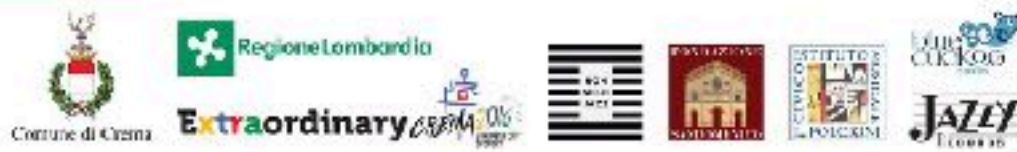
IMMAGINE: UNO DEI MANIFESTI DELL'EDIZIONE 2016

Locandine: per l'affissione in negozi, bar e altri luoghi pubblici. Progettazione, realizzazione, stampa, dimensione A3 in quadricromia su carta 170 gr finitura opaca.