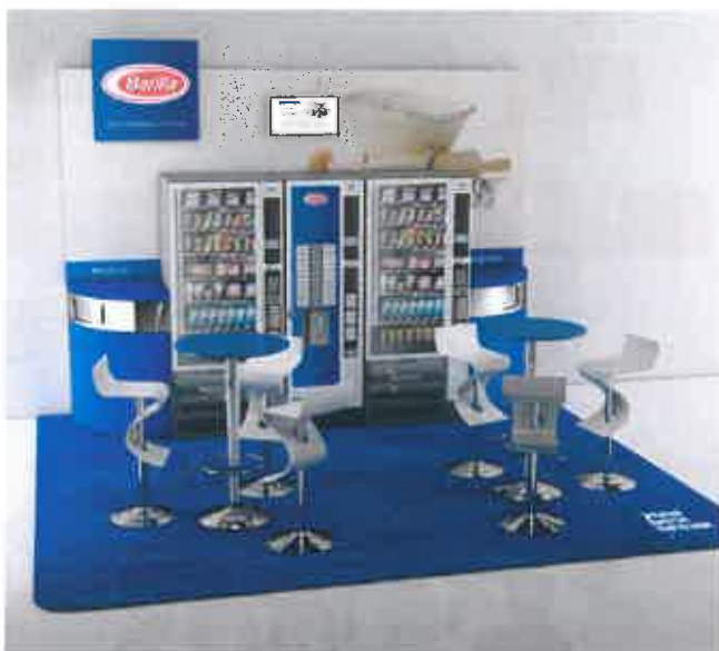
Realizzazione presso il cliente Barilla