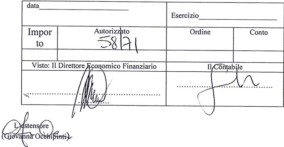
Tabella da inserire in calce al dispositivo della delibera