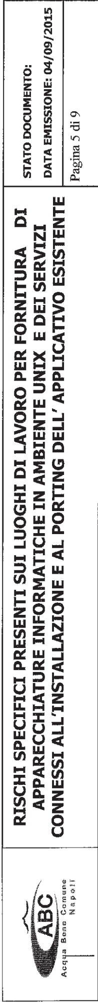
Tabella 1: Rischi specifici presenti nei luoghi di lavoro di ABC presso cui svolgere l'attività/servizio oggetto della fornitura