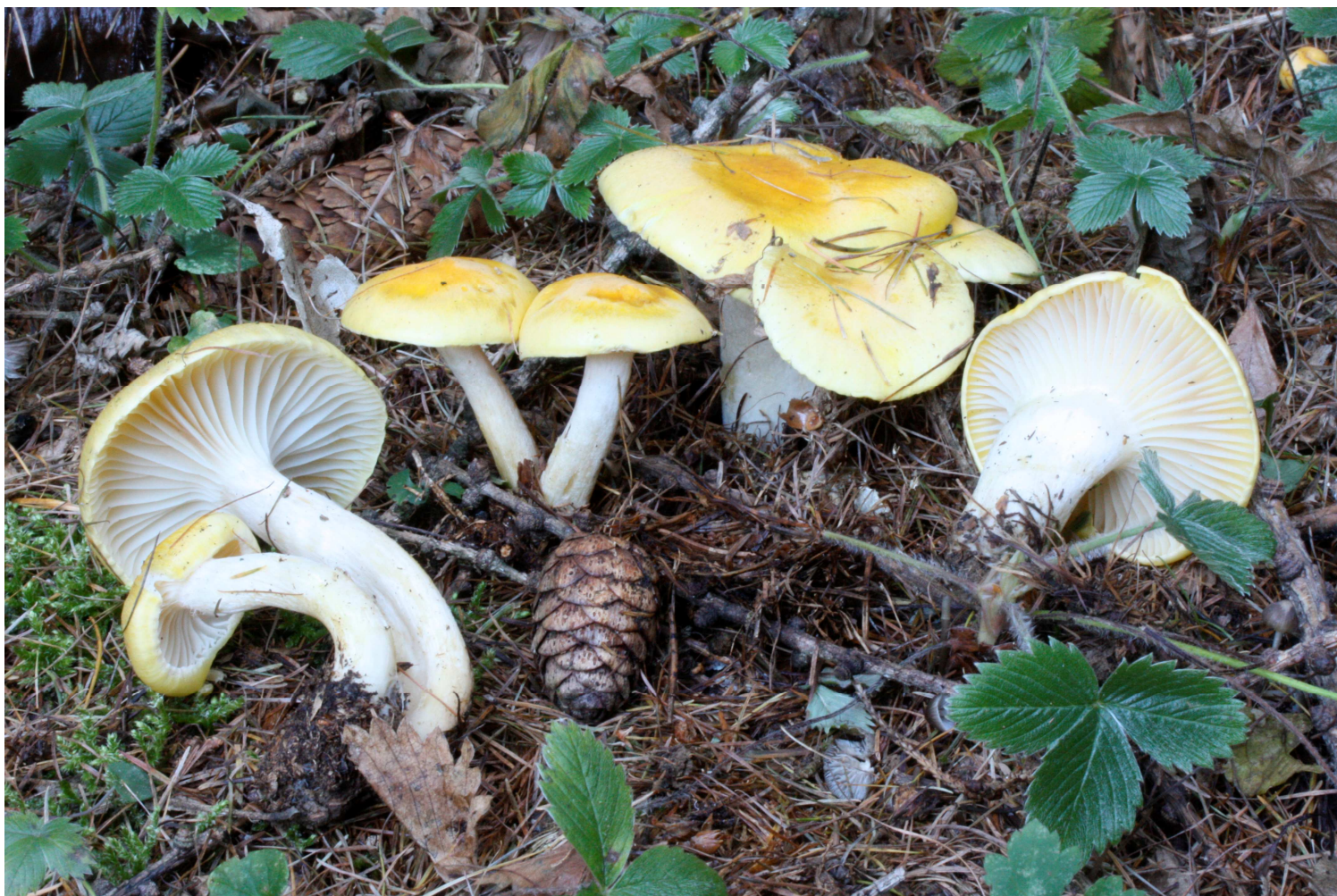
Hygrophorus Lucorum Kalchbr

Sala Conferenze C.R.E.A. del Comune di Pavia Via Case Basse Torretta 11/13 (accesso strada sterrata da Via Folperti)