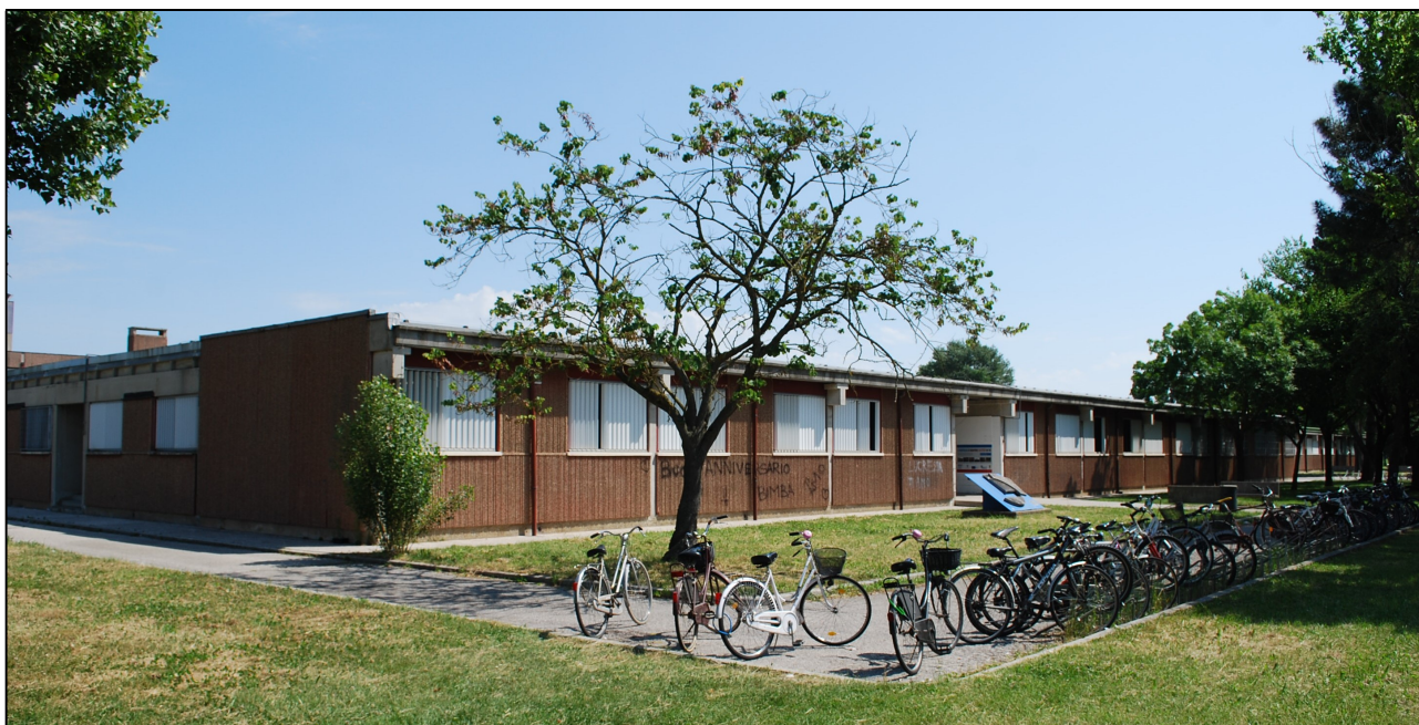
Vista lato sud del corpo principale della struttura.

Il corpo principale, ad unico piano fuori terra, ha una struttura portante realizzata con telai prefabbricati in c.c.a., completati da pannelli di tamponamento anch'essi prefabbricati in calcestruzzo.; la copertura è formata da tegoli a doppio T affiancati.