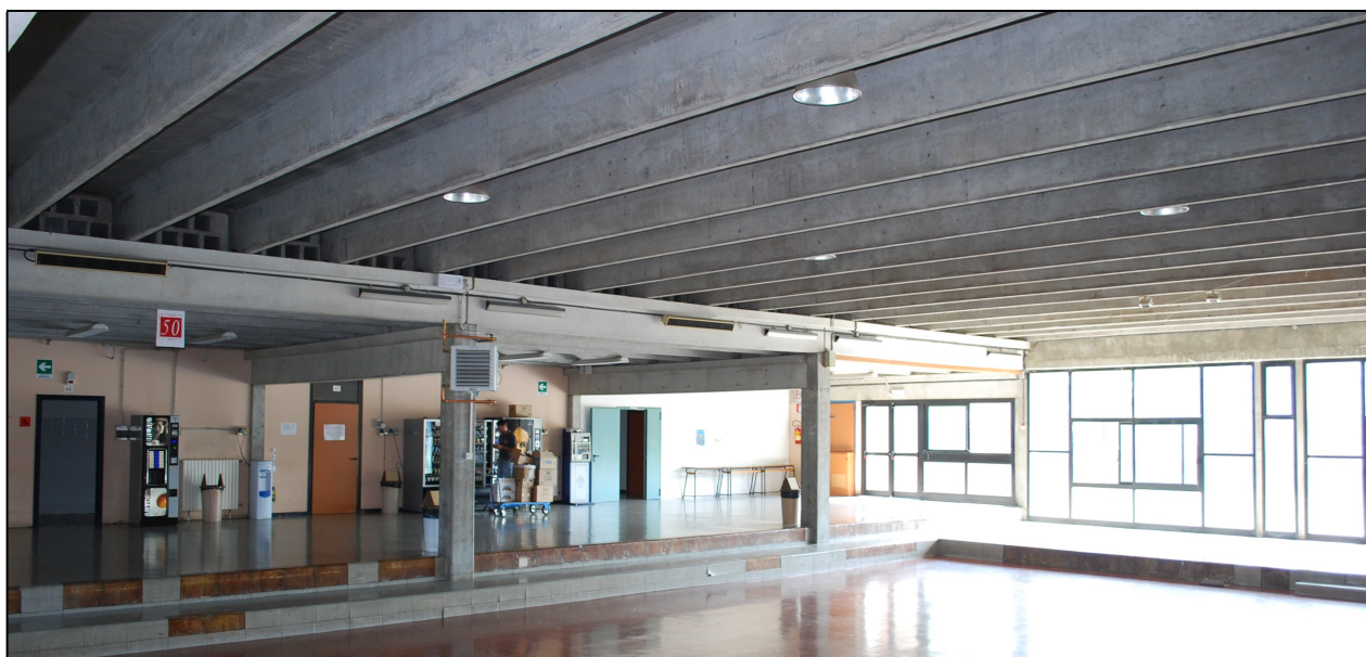
Foto dell'atrio interno dell'istituto.

Il rilievo geometrico-strutturale dello stato di fatto ha permesso di approfondire la conoscenza del complesso edilizio, oltre che di definire in maniera preliminare il comportamento strutturale e le vulnerabilità che gravano sulla struttura. In particolare si è riscontrata la presenza di carenze di tipo strutturale nei confronti delle azioni sismiche secondo l'attuale normativa: