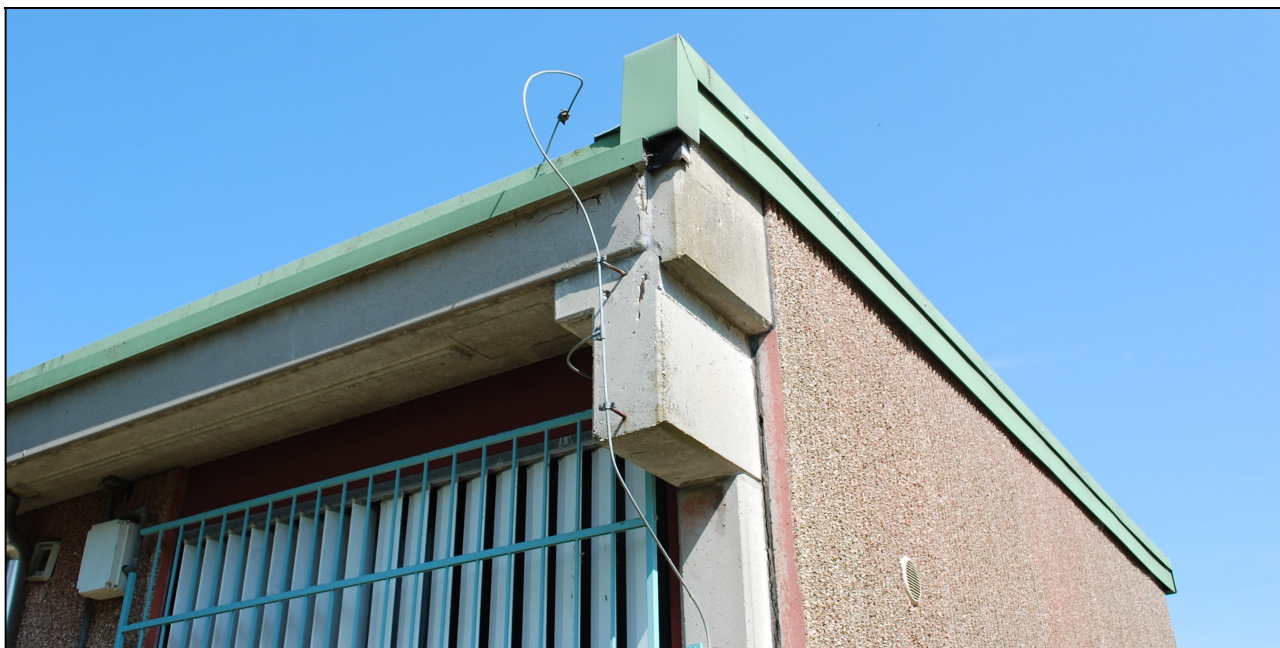
Particolare della struttura prefabbricata in c.a.