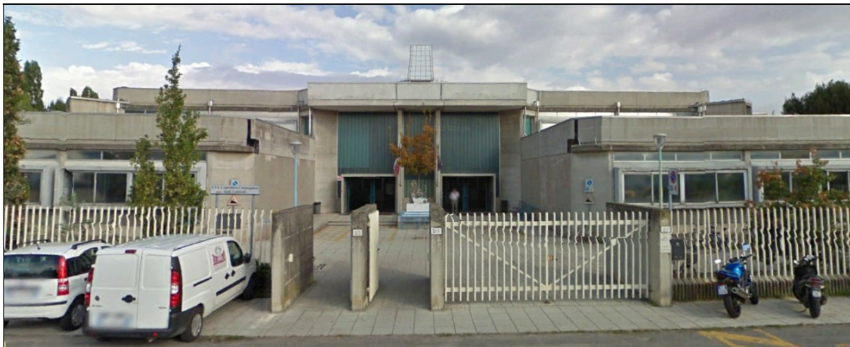
Prospetto sud – ingresso principale dell'istituto scolastico