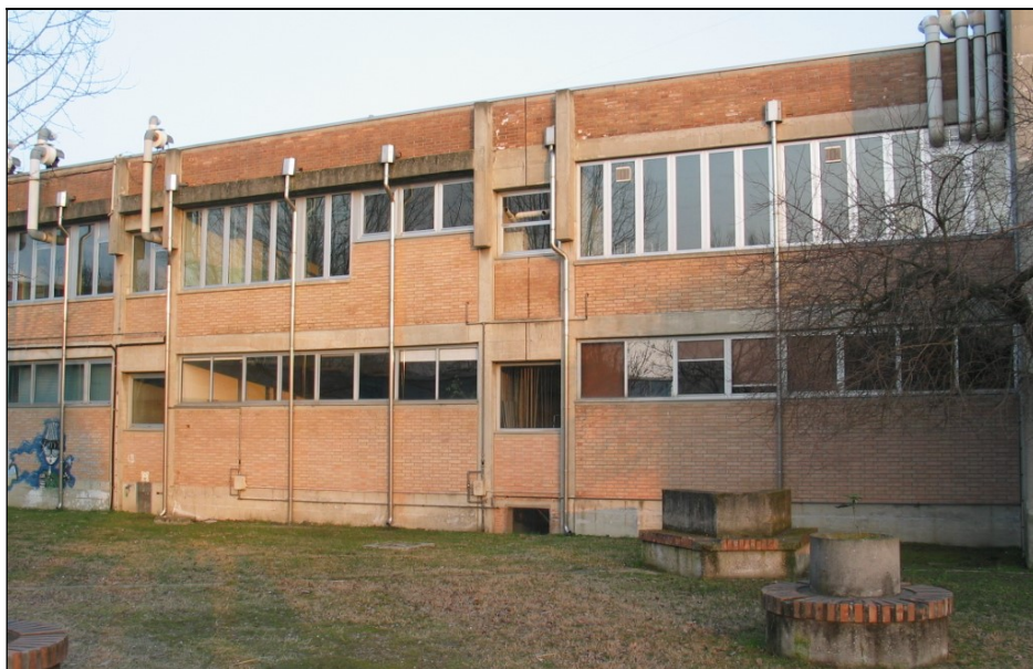
Prospetto nord dell'istituto scolastico