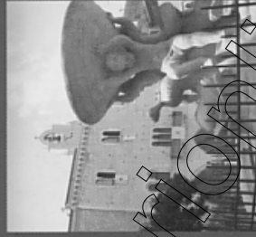
La Fontana dei Delitti