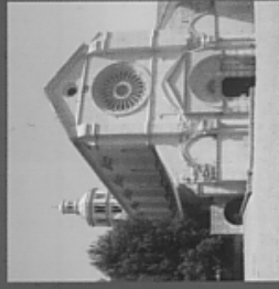
Abbazia di Fossanova