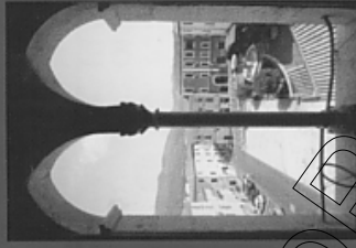
Piazza Giovanni XXIII dal Palazzo Comunale