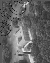
Castello di San Martino