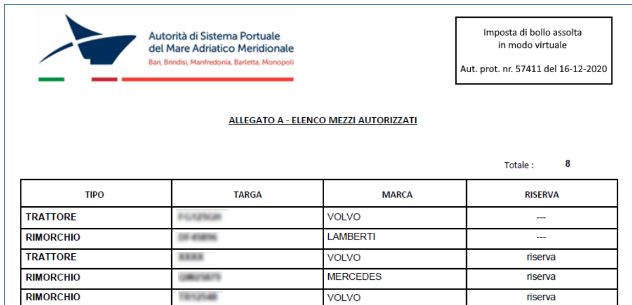
Figura 7 – Dettaglio mezzi autorizzati