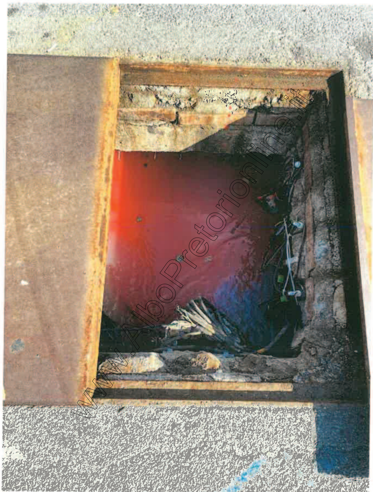
Figura 1 LIVELLO DEI REFLUI SOLLEVAMENTO S18 – 17.06.2023