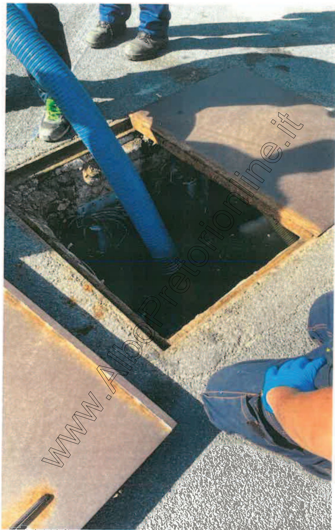
Figura 3 INTERVENTO AUTOSPURGO DA PARTE DEL GESTORE DEGLI IMPIANTI M.K.E.