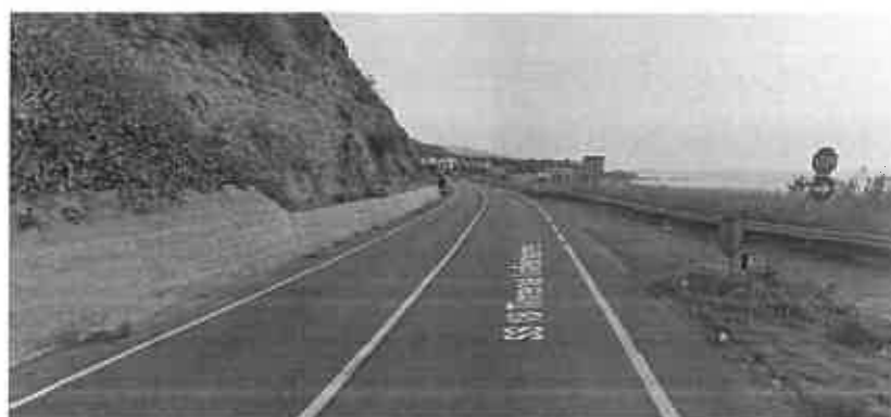
Figura 1 Km 276+700