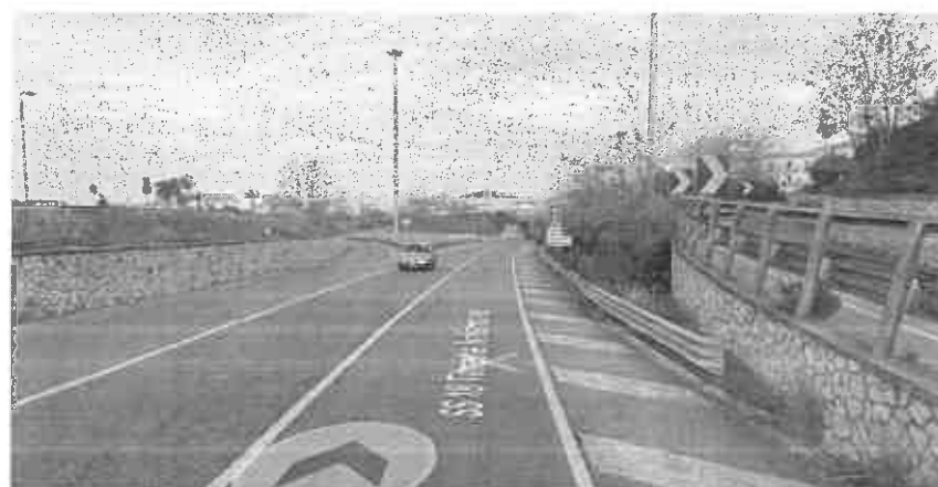
Figura 2 Km 282+800